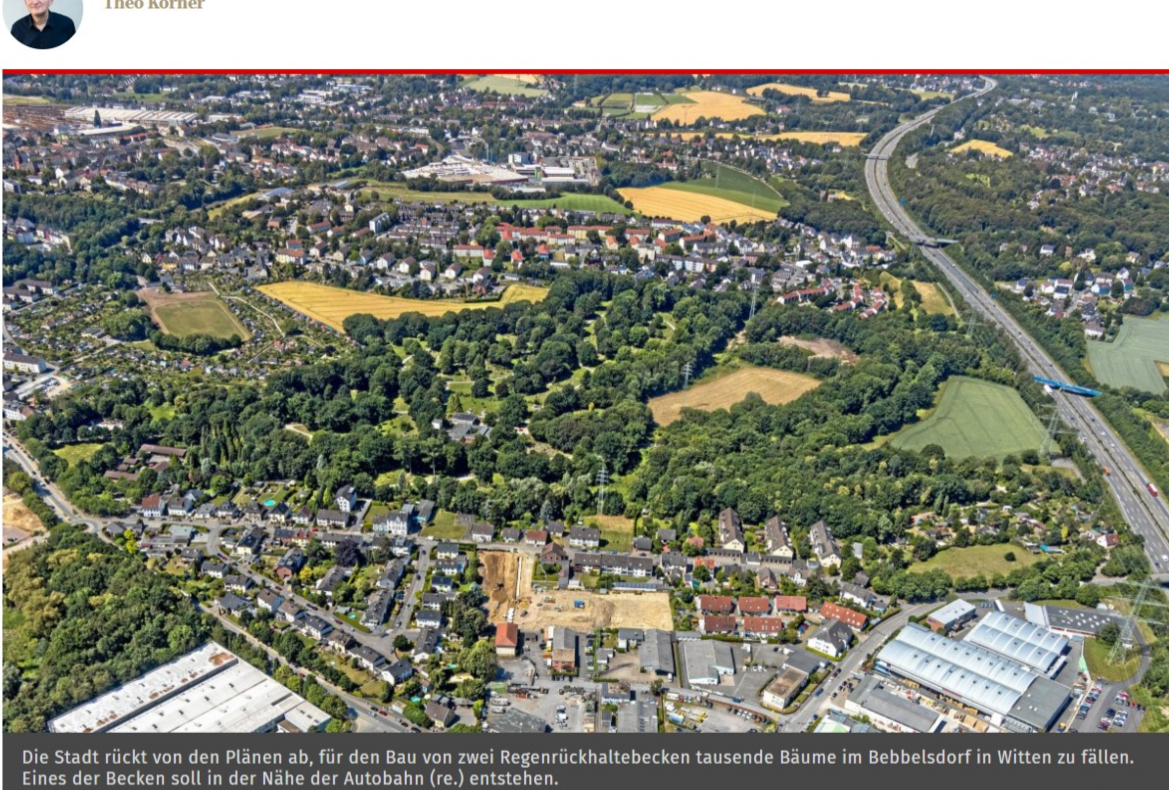
Die Stadt rückt von den Plänen ab, für den Bau von zwei Regenrückhaltebecken tausende Bäume im Bebbelsdorf in Witten zu fällen. Eines der Becken soll in der Nähe der Autobahn (re.) entstehen.

25.08.2023, 12:53 | Lesedauer: 3 Minuten Theo Körner