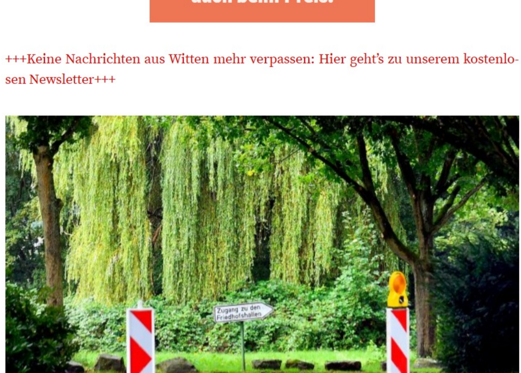
Bei Starkregen stellt der Hauptfriedhof an der Pferdebachstraße in Witten häufiger unter Wasser.

+++Keine Nachrichten aus Witten mehr verpassen: Hier geht's zu unserem kostenlosen Newsletter+++