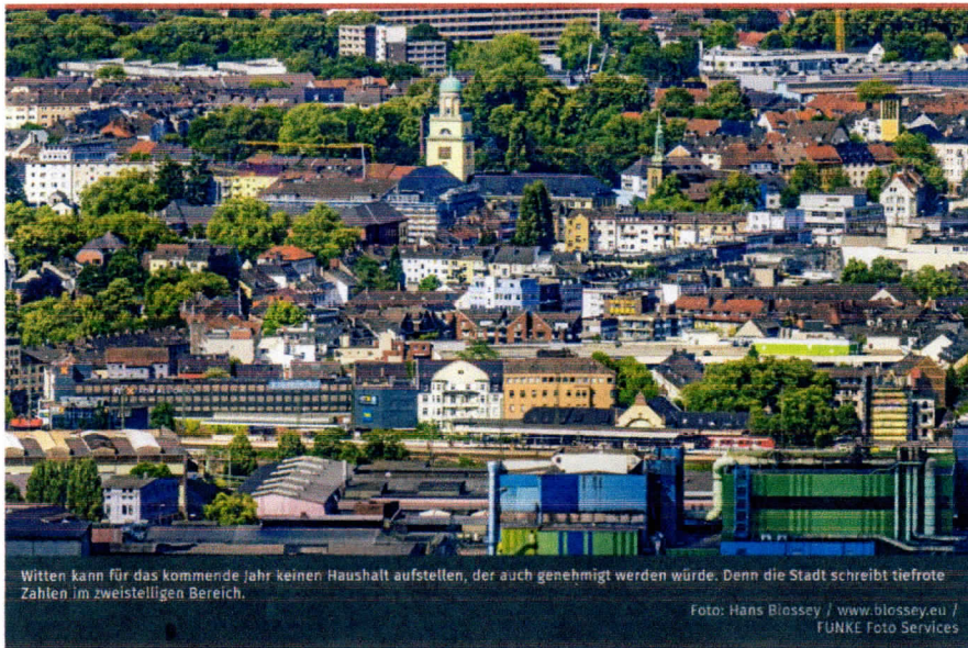
Witten kann für das kommende Jahr keinen Haushalt aufstellen, der auch genehmigt werden würde. Denn die Stadt schreibt tiefrote Zahlen im zweistelligen Bereich.

Aktualisiert: 27.07.2023, 05:02 | Lesedauer: 4 Minuten Stephanie Hesse