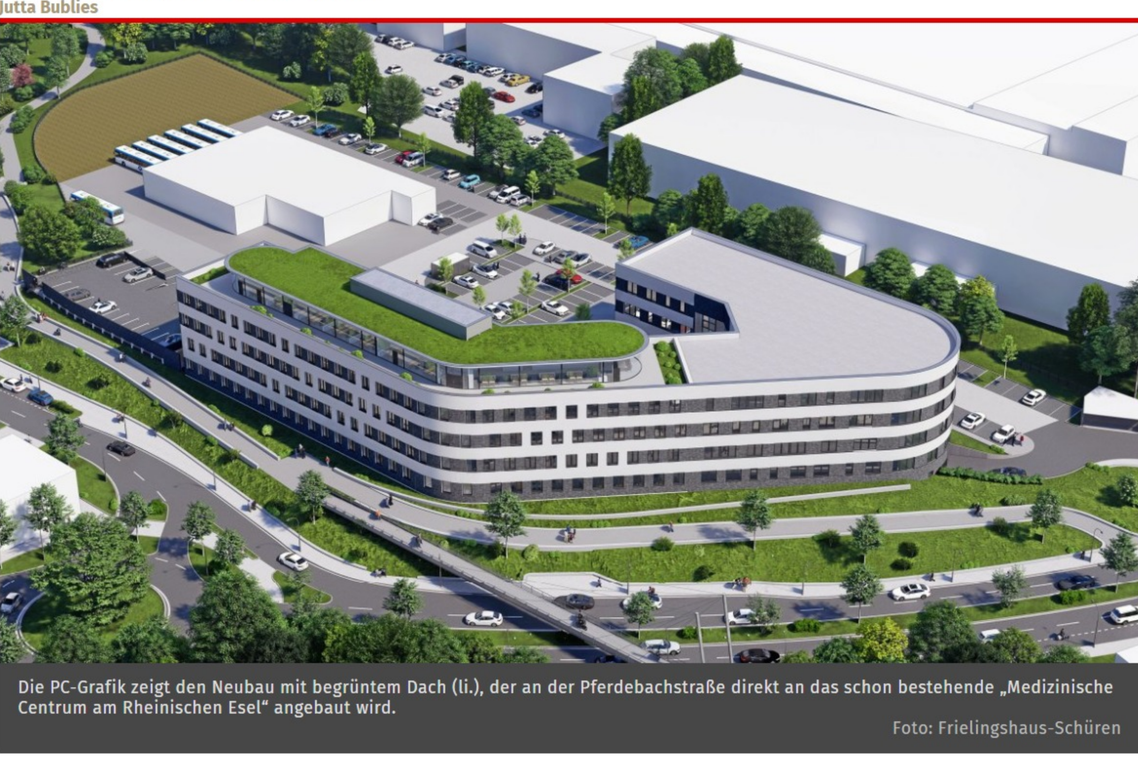
Die PC-Grafik zeigt den Neubau mit begrüntem Dach (li.), der an der Pferdebachstraße direkt an das schon bestehende „Medizinische Centrum am Rheinischen Esel“ angebaut wird.

Aktualisiert: 24.10.2021, 08:00 | Lesedauer: 3 Minuten Jutta Bublies