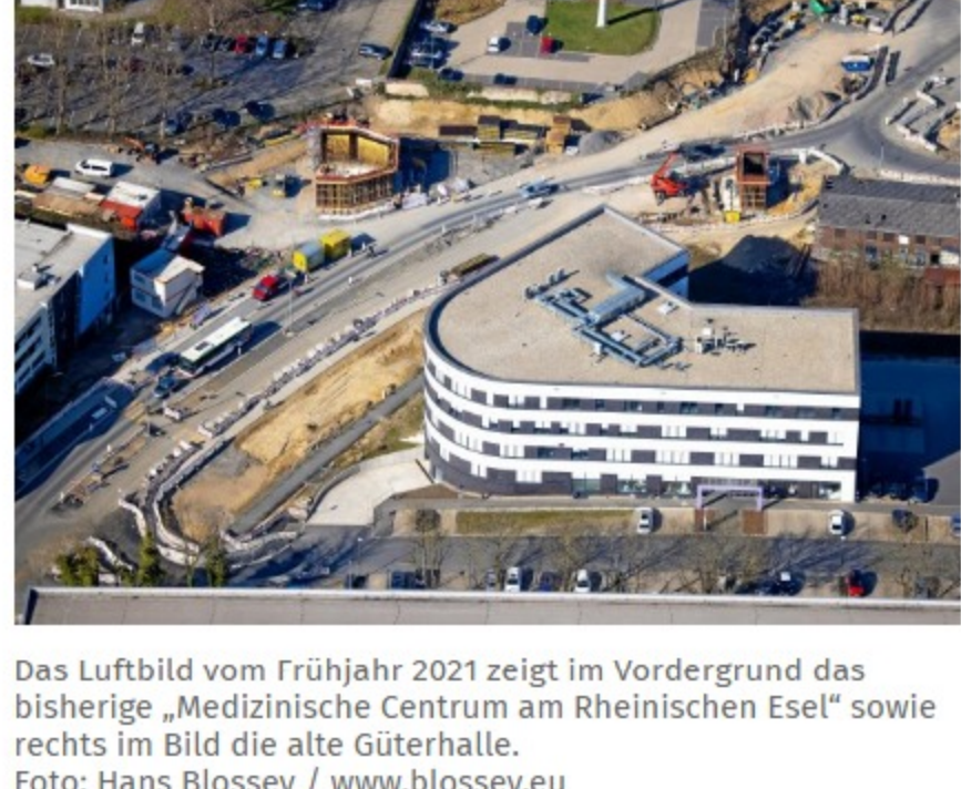
Das Luftbild vom Frühjahr 2021 zeigt im Vordergrund das bisherige „Medizinische Centrum am Rheinischen Esel“ sowie rechts im Bild die alte Güterhalle.

Mietinteressenten gibt es bereits, so der Architekt. Auch ein Steuerberater werde in den Neubau einziehen. Weitere Mieter werden gesucht - auch in den Nachbarstädten. Sei ein Großteil der Mietverträge abgeschlossen, könne mit dem Neubau begonnen werden, so Architekt Guetsoyan. Er rechnet mit einer Fertigstellung des Gebäudes bis Ende 2023/Anfang 2024. Als Bauzeit wird nach den bisherigen Planungen etwas über ein Jahr veranschlagt.